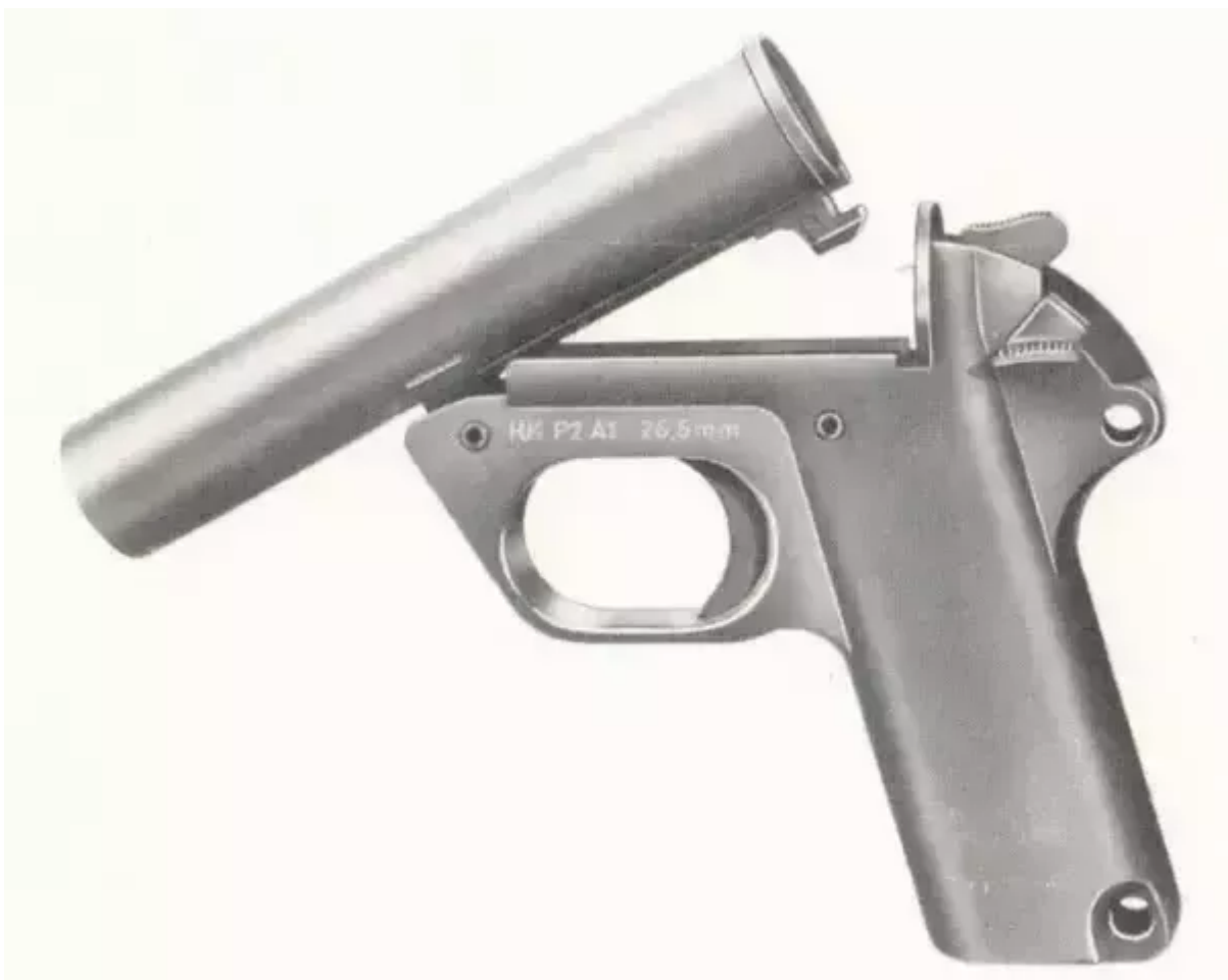
Figure 1: Opened signal pistol

To unload, press down the barrel release again. The spent cartridge is partially extracted and can be removed from the barrel.